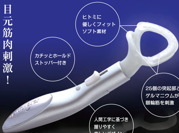
ヒトミぱっちりトレーナー