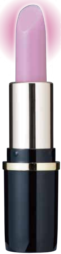
※肌に商品の色はつきません