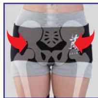
骨盤・股関節サポート