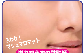
崩れ知らずの鉄壁顔

秘密はこれ! 皮脂吸着パウダーが脂浮きをぐんぐん吸着美肌成分とW効果で時間が経つほど透明肌