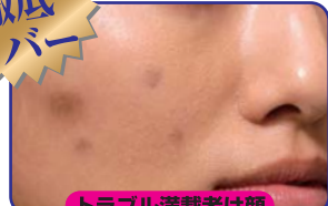
トラブル満載老け顔