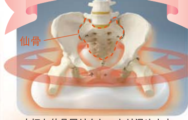
大切な仙骨周りもしっかり温めます