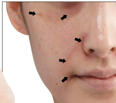
様々なトラブルストレス肌