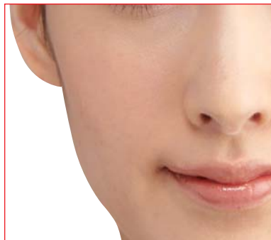
空気を通してしっかりカバー