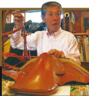
ライディングショップ池上