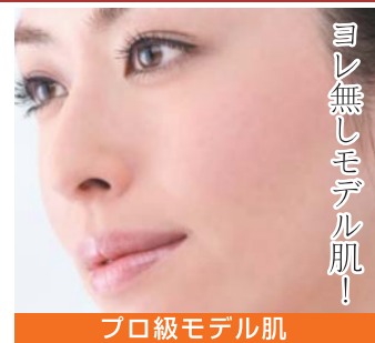
ヨレ無しモデル肌!

メイクしてから長時間たち、厚塗りしたファンデがヨれた状態。皮脂が浮き出てテカリ、毛穴が目立ってしまいます。薄付きなのにキレイに仕上がる、崩れにくい下地です。いつまでもモデルのようなヨレ知らずの凛としたメイクへ