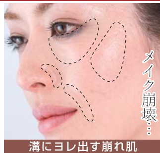
メイク崩壊... 溝にヨレ出す崩れ肌